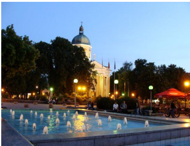
Fontanny i plac Konstytucji 3 Maja w roku 2008

czas się rozwija i nabiera nowego charakteru.